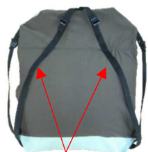
アジャスター付き 取付ベルト