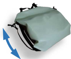
左右のひもによる伸縮で 厚み調整