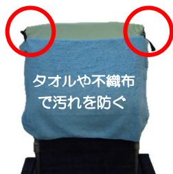
タオルや不織布 で汚れを防ぐ