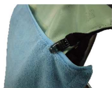
フィッシュクリップで、 タオル等を簡単取付