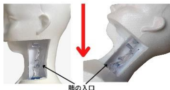
横から見た「のどの内部」